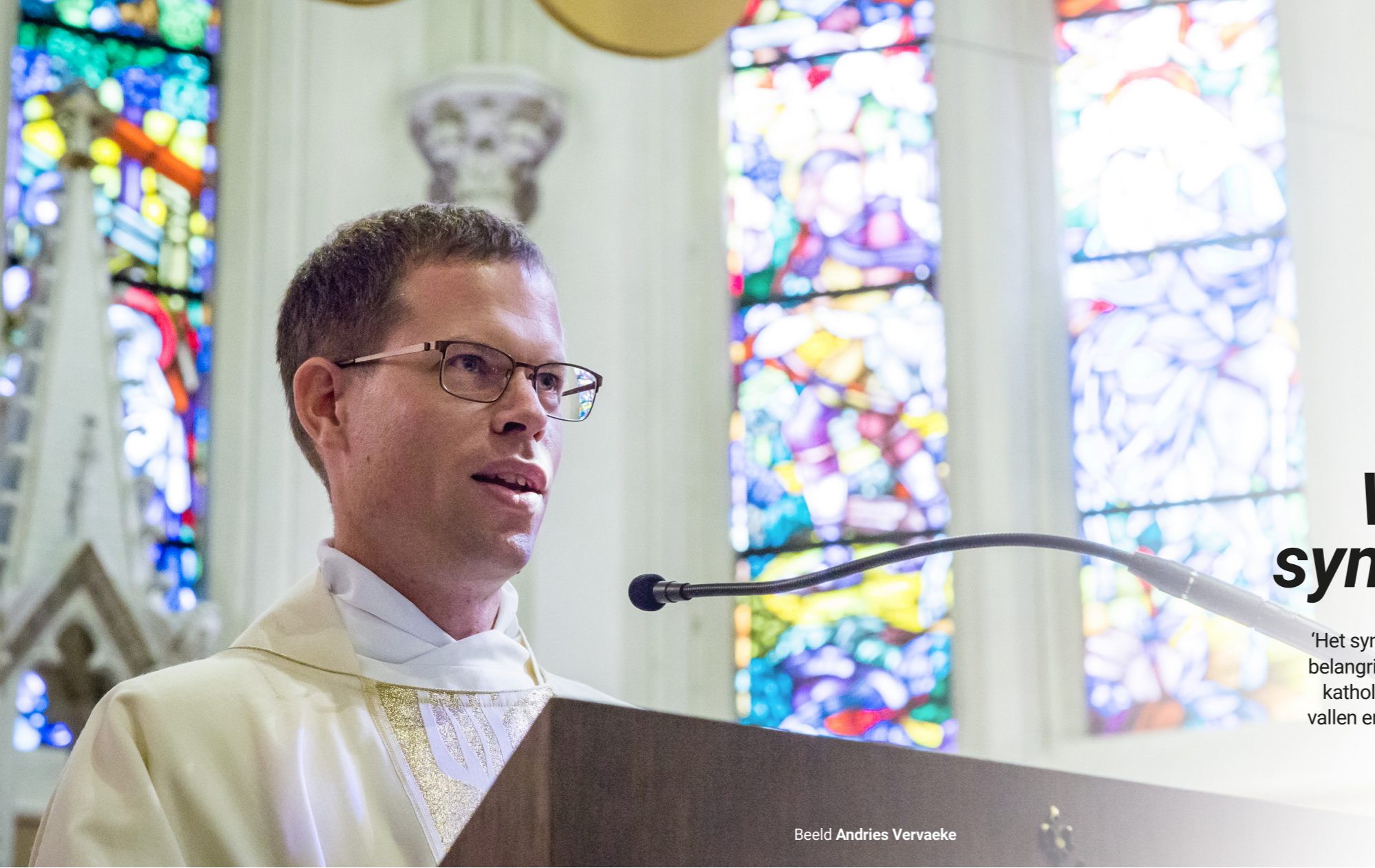
Beeld Andries Vervaeke