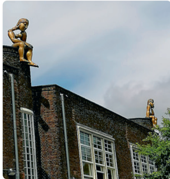
Buiksloterweg, achterkant van een gebouw aan de Wingerdweg, Amsterdam Noord

op het dak van een gebouw. Ze zitten ongeveer twintig meter van elkaar verwijderd en kijken dromerig van boven naar het speeltuintje. 'Zie je ze?' Het meisje staart naar boven en knikt. 'Je kan door ze heen kijken. Ze lijken op mensen, maar ook weer niet. Mensen zitten anders in elkaar. We weten niet hoe engelen eruitzien. De beeldhouwster heeft dit zelf bedacht. Fantasie. Leuk hè?' Het meisje pakt haar fietsje op. 'Ik snap er niets van. Wat een raar verhaal.' Ze fietst er vandoor.