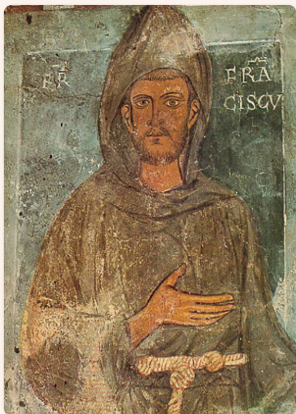
Oudst bekende afbeelding van S. Francesco fresco 13e eeuw, anoniem