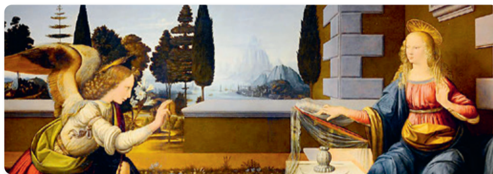
Gabriël annunciatie -Leonardo da Vinci

Er zijn door de eeuwen heen duizenden gedocumenteerde verklaringen van mensen die ontmoetingen beschrijven met engelen. In meerdere religies zien mensen vaak onder moeilijke omstandigheden gedaanten, omgeven door een onwaarschijnlijk mooi licht. Woorden schieten te kort. Zo mooi was het. Het zijn vaak rustgevende ervaringen waar mensen liever niet over praten uit angst voor gek te worden verklaard. We herkennen deze terughoudendheid ook bij mensen met een bijna-dood-ervaring. De engelen verschijnen opvallend vaak aan bescheiden mensen die onopvallend door het leven gaan. Je leest vaak dat ze zelfs op hoge leeftijd de ervaring, die tientallen jaren